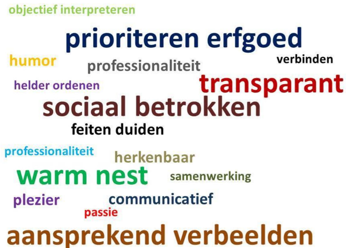
Fig.2: Kernwaarden Heemkundekring Blariacum

3. KERNWAARDEN: Wat is onze identiteit? Waar geloven we in, wat verbindt ons en wie willen we zijn? Zie fig.2