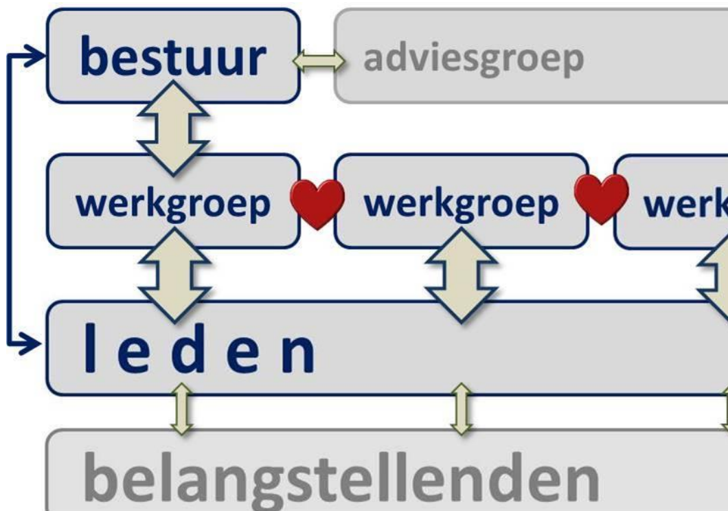
Fig.3: Organisatie Heemkundekring Blariacum

Het bestuur bewaakt de grondregels, vastgelegd in de statuten. Dit zijn de bepalingen die ten grondslag liggen aan de vereniging , en die in de notarieel verleden akte van oprichting zijn vervat. De vereniging heeft de ANBI-status (Algemeen Nut Beogende Instelling).